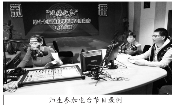
师生参加电台节目录制

高职教育培养的是高素质技能型人才，高职教育者须以高度的历史责任感和使命感，进一步增强传统文化教育，弘扬中华民族优秀传统文化和社会主义核心价值观，唱响时代主旋律。