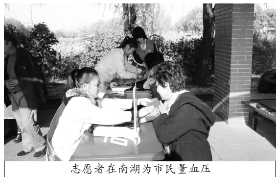
志愿者在南湖为市民量血压

本次志愿服务活动内容共分为六项：一是做了以社会主义核心价值观为主题的宣讲，并向广大市民发放社会主义核心价值观小卡片500余张，积极宣传社会主义核心价值观；二是宣传倡导低碳生活、生态环保的生活理念，提倡在生活中尽量做到节能减排；三是宣传防御雾霾小常识，发放一次性医用口罩500余个，提倡绿色出行，减少排放，抵抗雾霾；四是免费为市民朋友测量血压150余人次，提醒广大市民应随时关注健康；五是清理垃圾30余袋，倡导文明出行，还城市一片绿色；六是邀请广大市民同我院志愿者一起在主题条幅上签名，表明对此次公益活动的支持以及保护环境、低碳出行的决心。